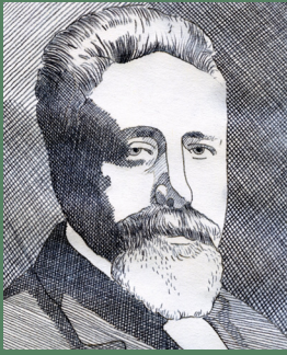
Vito Volterra 1860-1940

Vito Volterra est surtout connu pour ses travaux sur les équations intégré-différentielles, la dislocation des cristaux et la dynamique des populations. Il fut un opposant résolu au fascisme, n'hésitant pas à renoncer aux honneurs académiques par conviction politique.